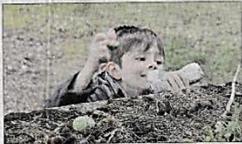
Un moment de joie et de partage qui a ravi petits et grands. V.E.L.

L'entreprise Vaissier aliments a organisé le mercredi 12 avril dans le magnifique parc de l'Abbaye de Loc-Dieu une grande chasse aux œufs qui a réuni une soixantaine d'enfants qui ont également pu profiter de nombreuses animations et de jeux destinés à la clientèle de cette entreprise martelloise spécialisée dans l'alimentation animale.