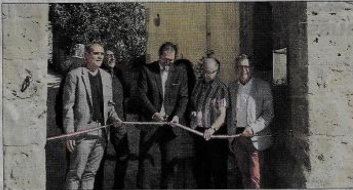
La coupure du ruban.

Ensuite il a été procédé de la même manière à l'inauguration de « la salle mémoire » de Martiel où se trouvent des documents ayant trait à l'his-