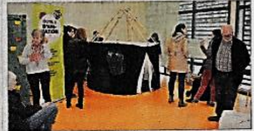
La yourte une approche ludique de la lecture.