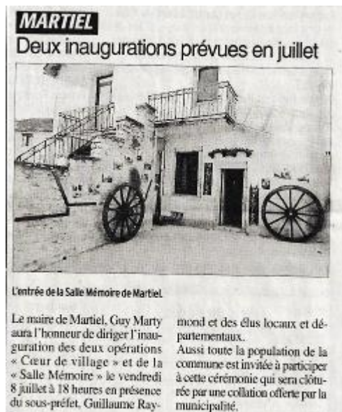
La Dépêche du 21 juin 2022