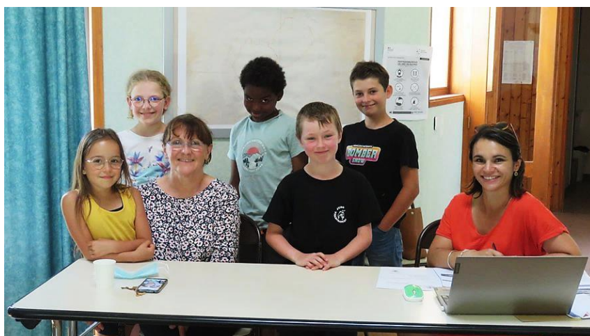
La Dépêche 06/07/2022