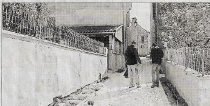
Travaux dans la ruelle du cœur historique de Martiel.

Les lavoirs de la Miquelie et de Fontaynous ont été également restaurés. La reprise du seuil en pierre et le remplacement de la porte sud de la tour de Martiel devrait être réalisés très prochainement. Tous ces travaux sont financés par le Département, la Région et la commune.