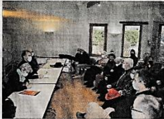
Les bénévoles ont du grain à moudre.L.V.

L'association a en effet aménagé intérieurement et extérieurement la salle d'exposition « mémoire de Martiel » afin d'améliorer l'identification du local et faciliter l'accès au fond documentaire, qui s'est enrichi du livret « Bannac et Fontaynous ». Le balisage des 6 circuits thé-