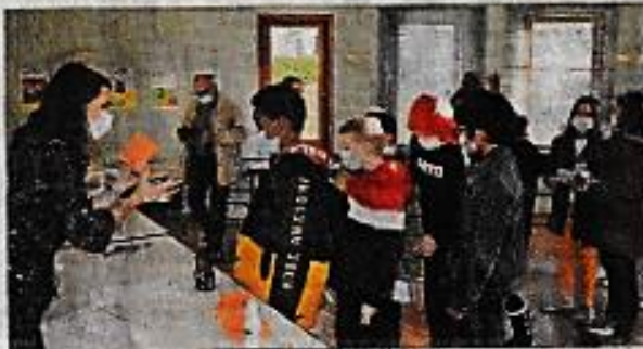
Le moment solennel du vote/L.V.

La première réunion aura lieu la première quinzaine du mois de janvier avec un budget et des propositions qui seront suivies d'effet, sans doute par un city stade à l'emplacement de l'ancien tennis avec le parking à