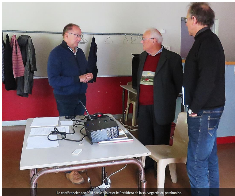
Le conférencier accueilli par le Maire et le Président de la sauvegarde du patrimoine.