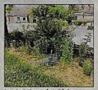
Les plantations près de l'église d'Ébes.

Pour les années à venir, la municipalité réfléchit à plusieurs actions possibles : création d'un « jardin communautaire » composé de fruitiers et de plantes aromatiques ; développement d'un partenariat avec l'école, valorisation de certaines espèces sauvages dans les chemins ruraux, favorisation des animations genre bourse d'échange de