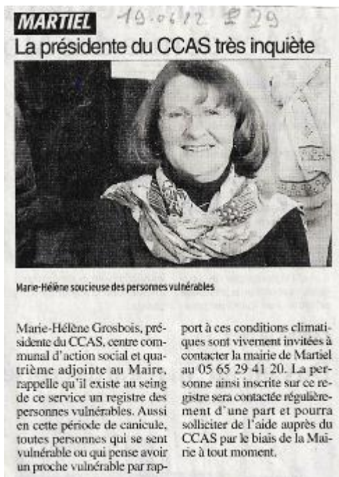
La Dépêche du 19 juin 2022