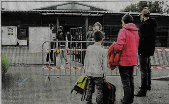
L'école de Martiel.