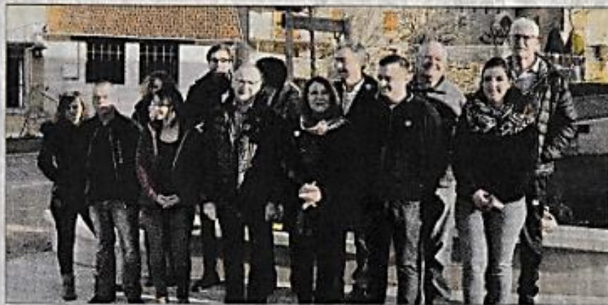
Le conseil municipal lors des élections en 2020

Concernant la participation de la commune au transport scolaire,