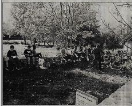
Au loivier de la Miquélie.