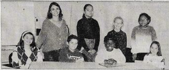
Les conseillers et leur présidente.

Une randonnée citoyenne « nettoyeurs la nature » a été organisée le 25 septembre 2022 en collaboration avec l'APE et l'association de sauvegarde du