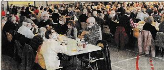
Grand succès pour le loto de l'association.