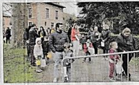
Le Villefranchois du 28 avril 2022