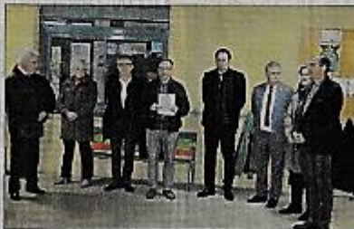
Lors de l'inauguration des travaux de restauration énergétiques de l'école.

Les travaux d'un montant de 577 000 € HT ont été financés à hauteur de 236 472 € par l'Etat, 98 193 € par la Région, 84 557 €