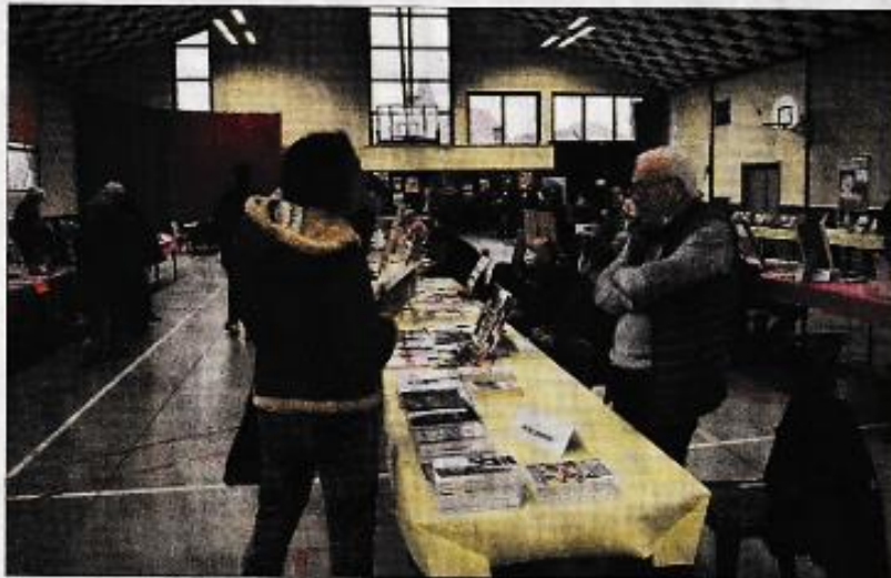
Une conversation engagée entre un auteur et une visiteuse/LV.

Certains ont profité de l'occasion pour faire découvrir au public