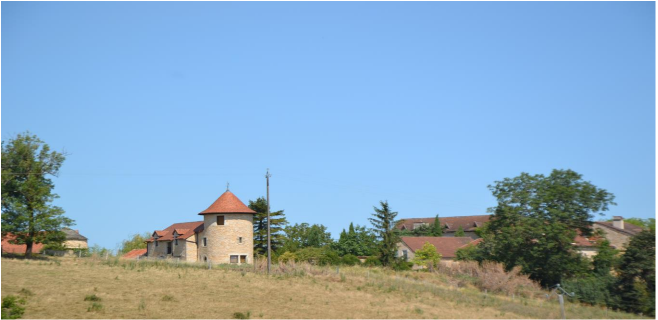
(1) Vue sur le hameau de Ginoulhac depuis la route de Marin