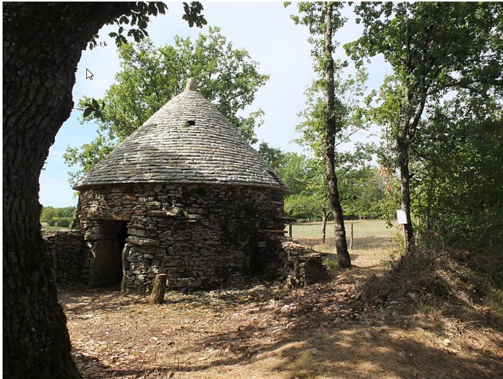
La caselle des Champs Grands et son aire de pique-nique