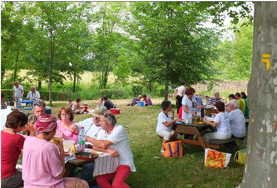
Aire de pique-nique du lavoir de Fontaynous (150m de l'église)