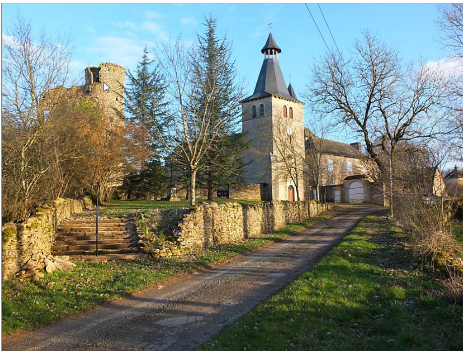
Fontaynous et les vestiges du château des abbés de Loc-Dieu